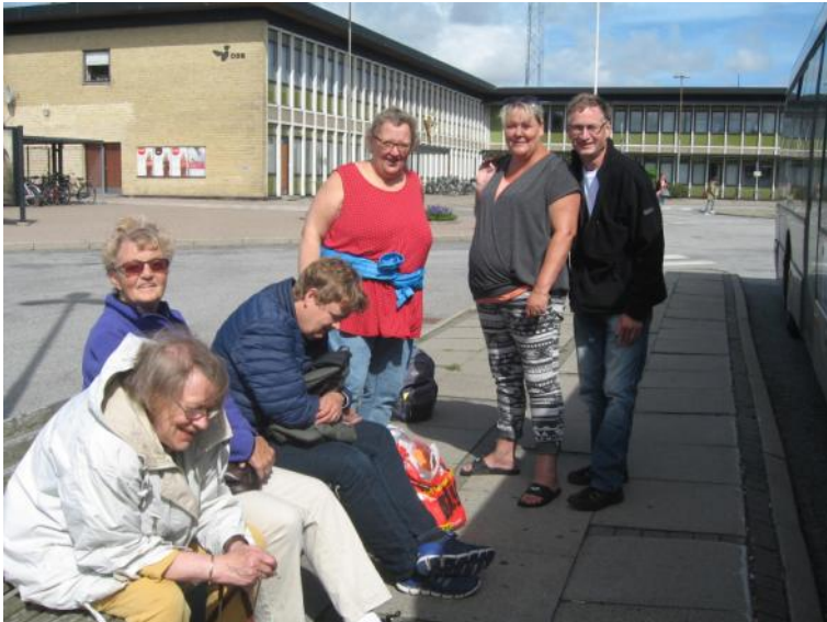
Ved busstoppestedet i Brønderslev.