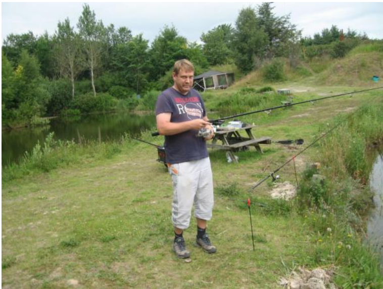
Med snøren ude.

Ved middagstid spiste vi frokost, som bestod af medbragte pølser og kartoffelsalat. Derefter var de to timer gået, og vi pakkede sammen og kørte hjem igen. PKB