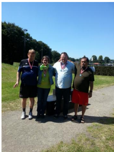
Sølvmedaljevinderne i holdkrof.