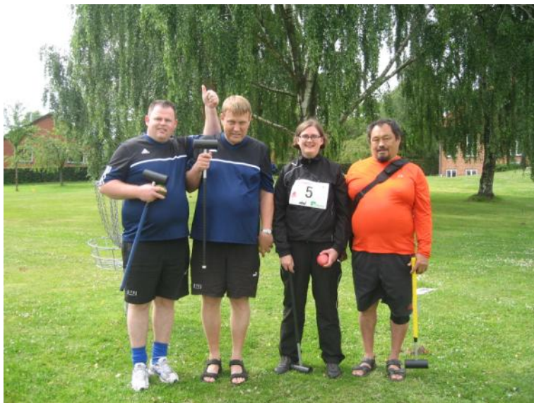
Det ene af BIFOS' krolfhold.