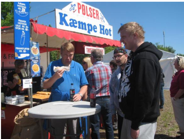
Undertegnede nyder en hotdog.