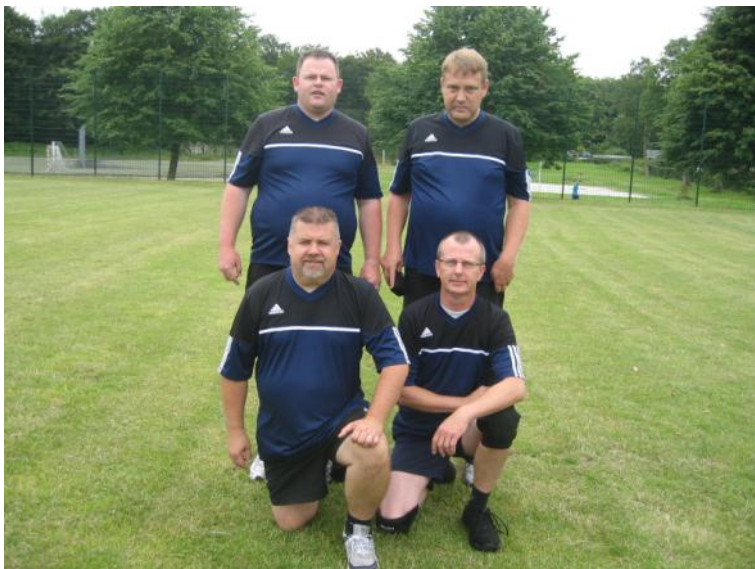
Volleyballholdet "BIFOS 1".