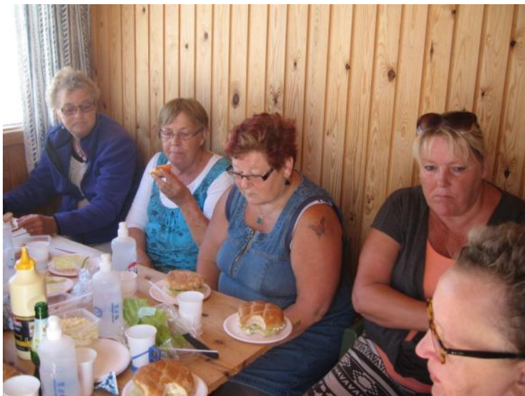
Der spises frokost.