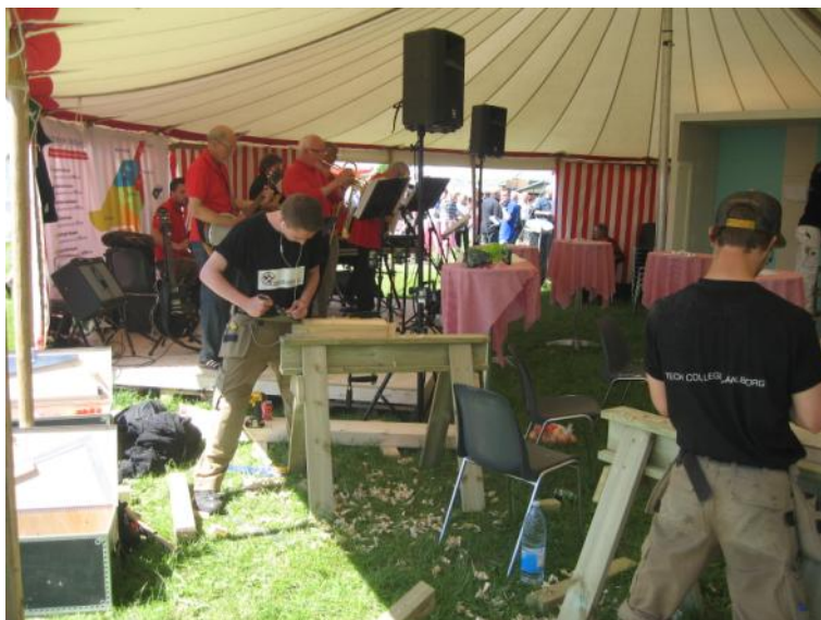
Tømrerelever fra Tech College Ålborg.