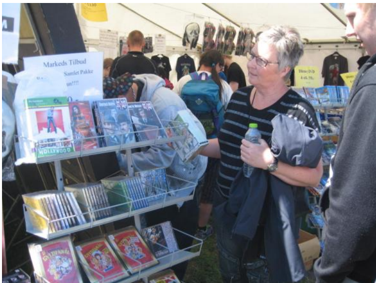
Der kigges på DVD'er.