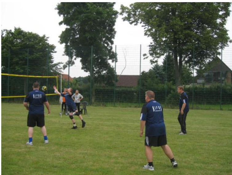
Der spilles volleyball.