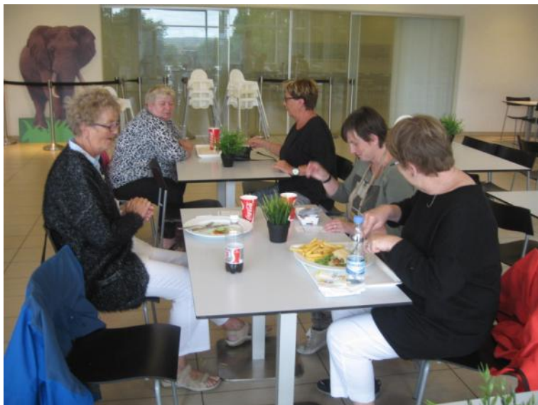
Der spises frokost.