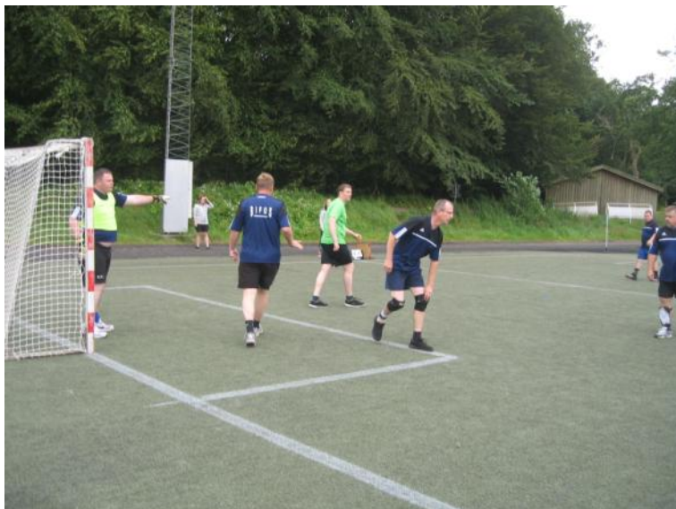
Der spilles fodbold.