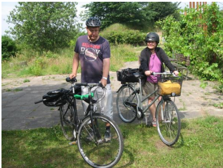
På vej hjem.