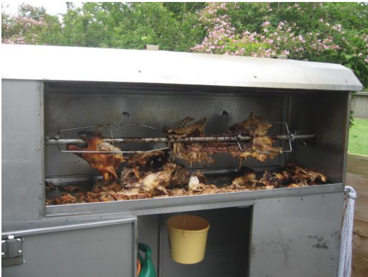
Resterne af grisen.