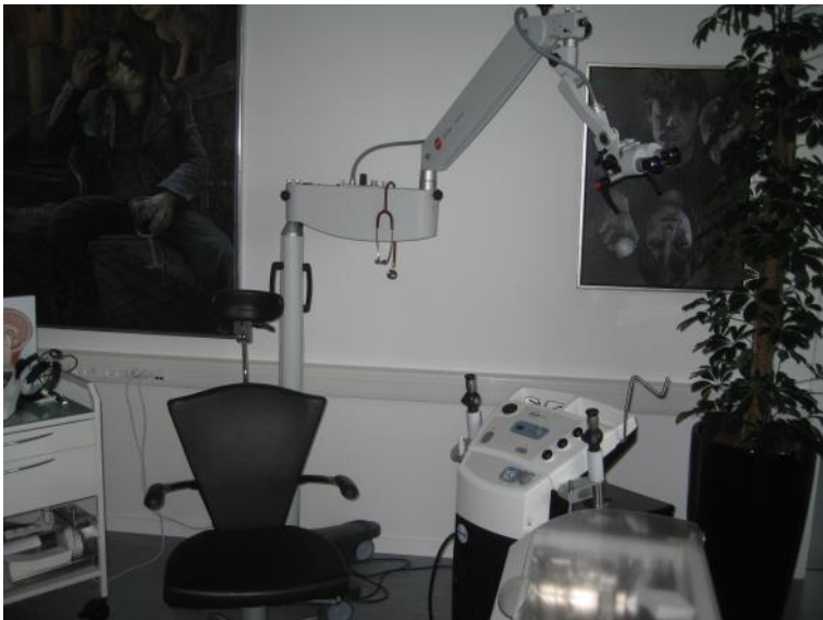
Øre- næse- halsklinikken.