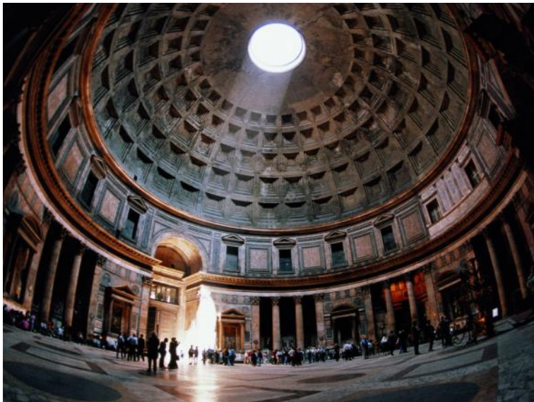
Pantheon med 'øjet' i toppen.