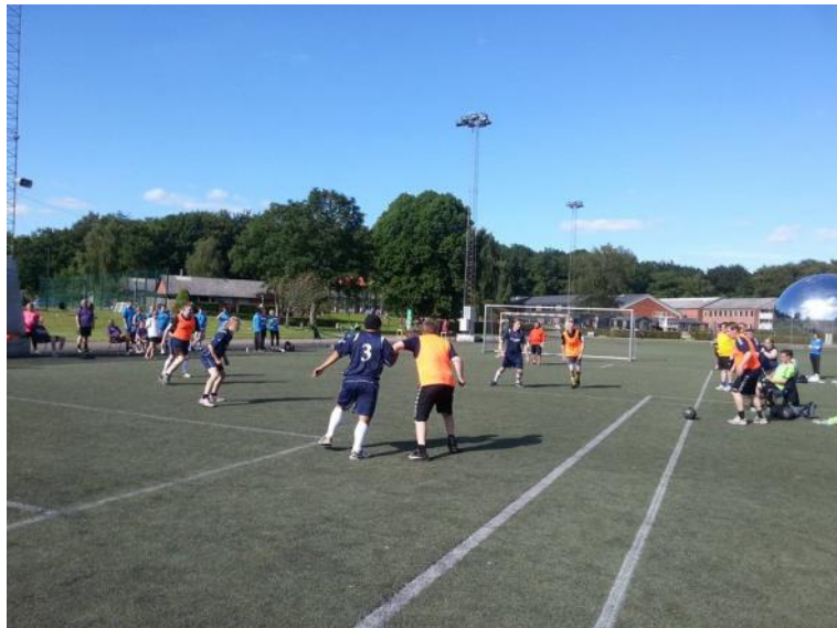
Der spilles fodbold.