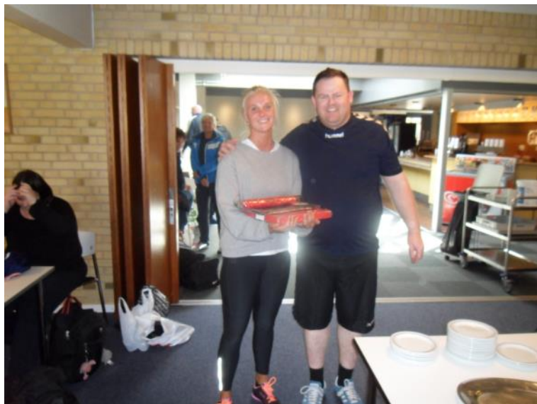
Vores dommer får overrakt en gave.