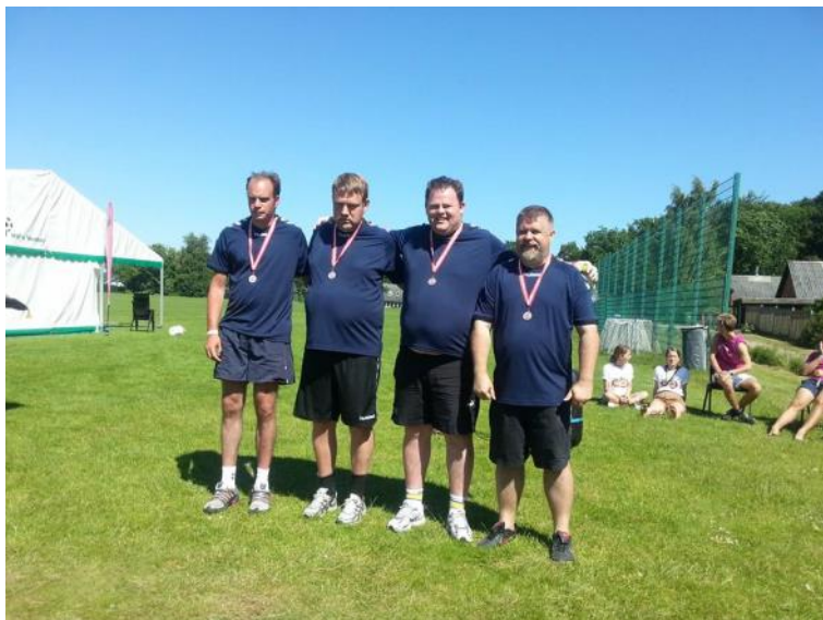
BIFOS 1 med sølvmedaljer.