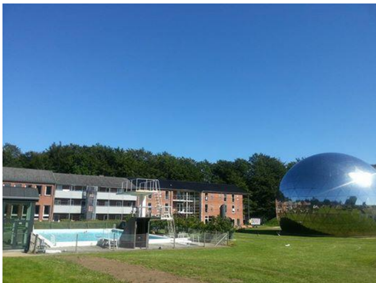
Vejle Idrætshøjskole med globen.