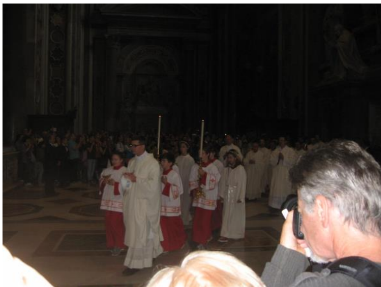
Kirkelig procession med præster.