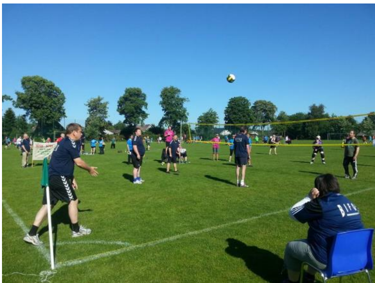
BIFOS 1 spiller volleyball.