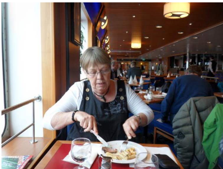
Der spises aftensmad.