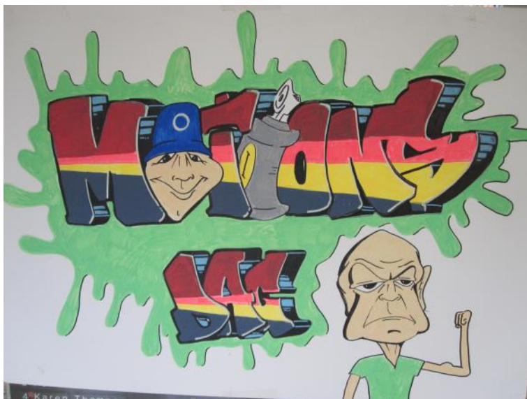
Skilt til motionsdag tegnet af Søren Philbert.