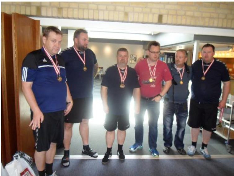
BIFOS 1 volleyball med guldmedaljer.