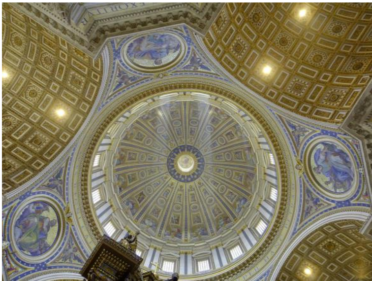
Michelangelos fantastiske kuppel.