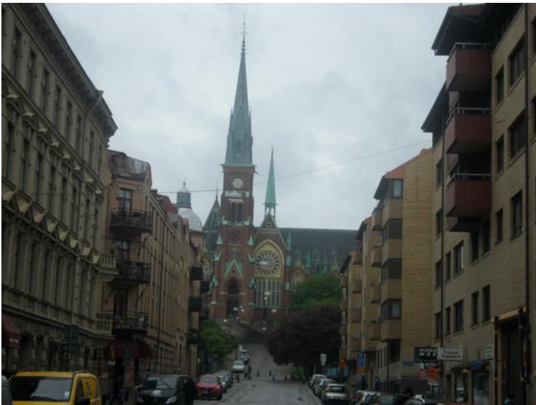
Kirke i Göteborg.