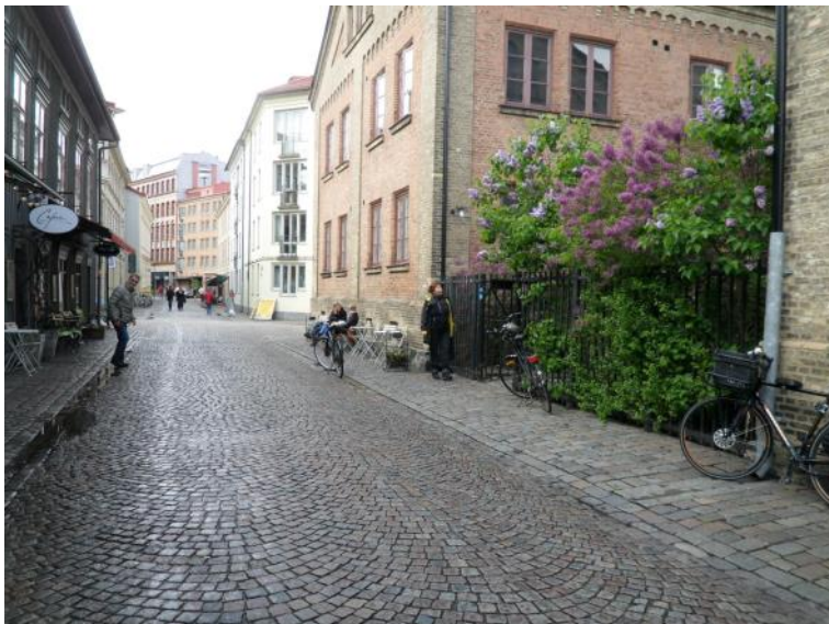
Gade i Gøteborg.