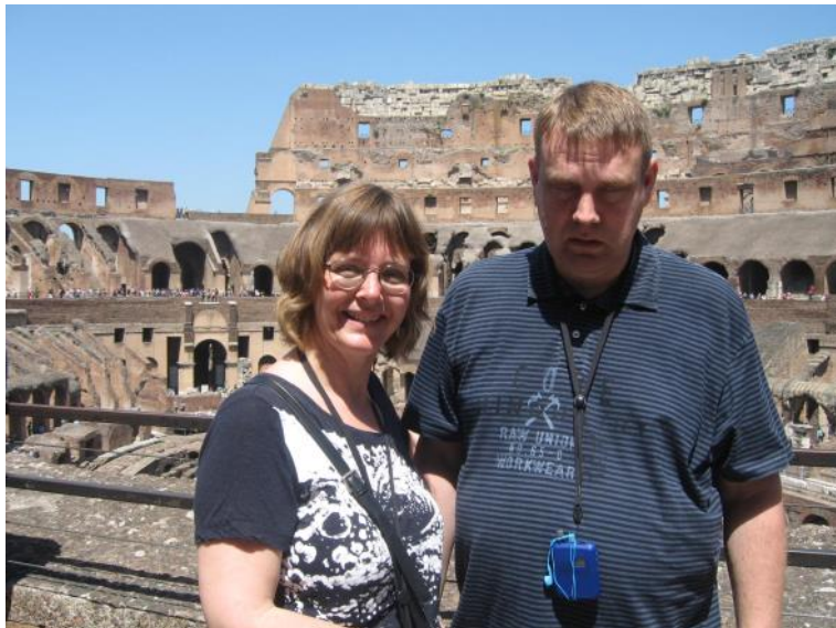
Med min søster.