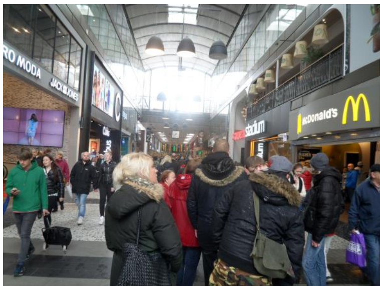
Nordstan - Skandinaviens største indkøbscenter.