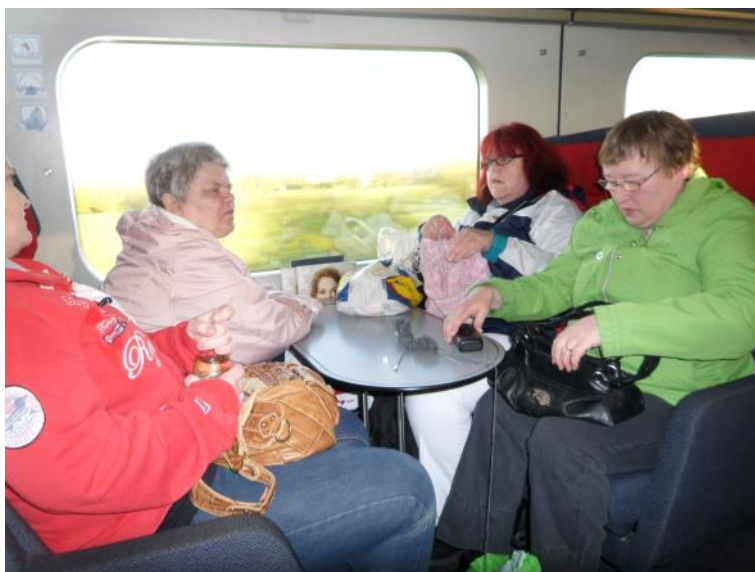
I toget mod Frederikshavn.