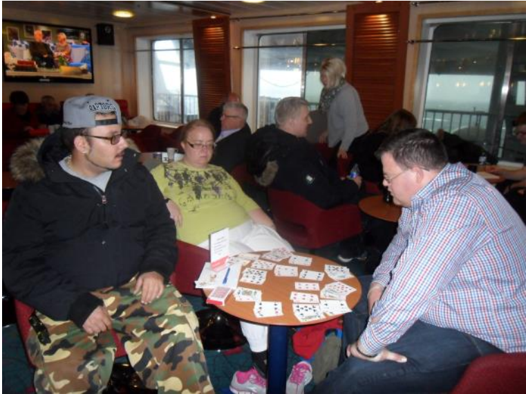
Der spilles kort.