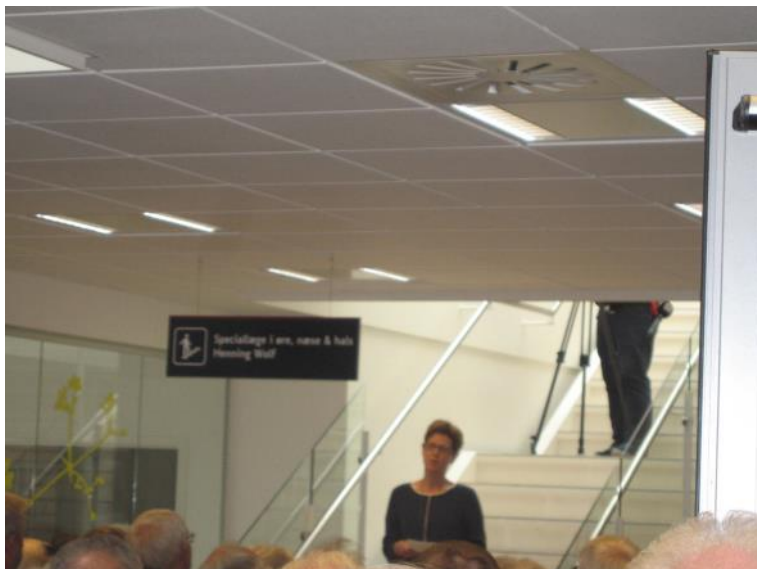
Regionsrådsformand Ulla Astman.