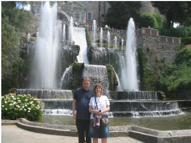
Villa d'Este med fontæne i baggrunden.