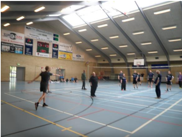
Der spilles volleyball.