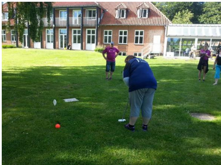
Der spilles krolf.