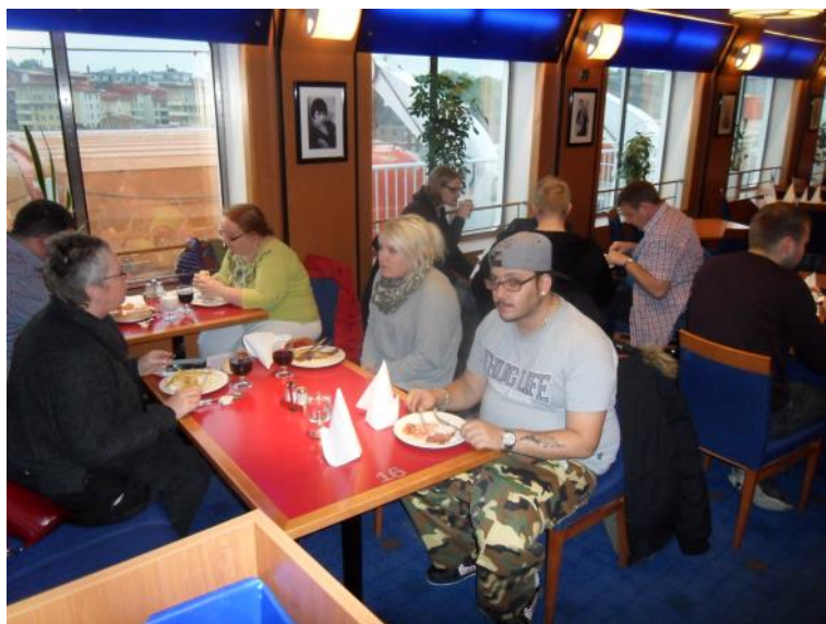
På færgen hjemad - der spises aftensmad.