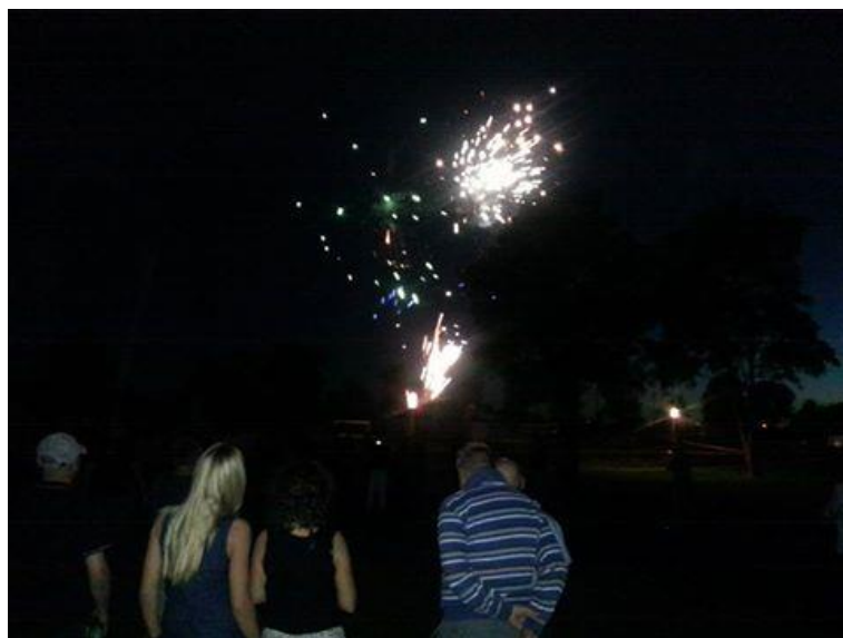
Festfyrværkeri ved midnat.