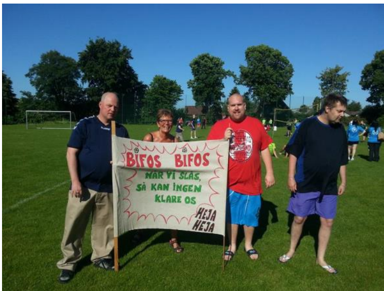
BIFOS med kampråb.