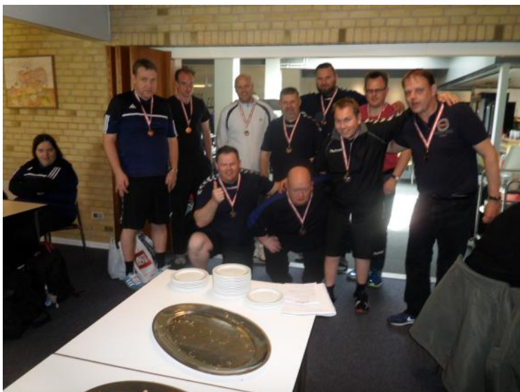
BIFOS' fodboldhold med bronzemedaljer.