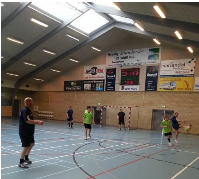
Der spilles fodbold.