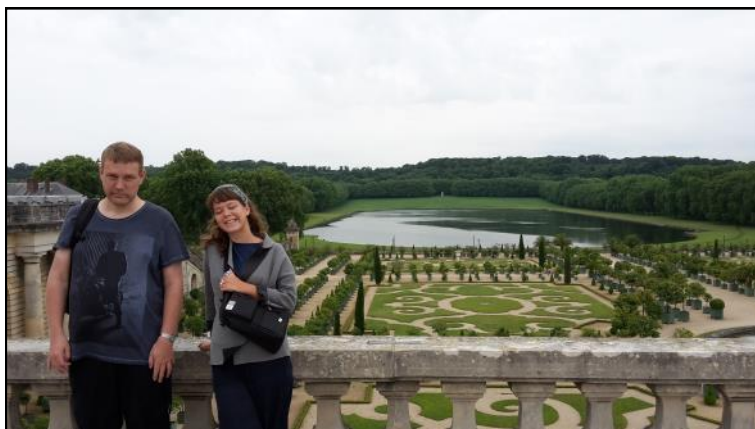
Udsigt over parken ved Versailles slottet.