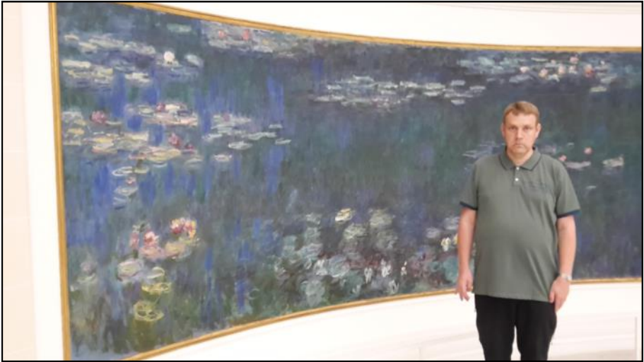
Orangeriet - væg til væg billede af Monet.