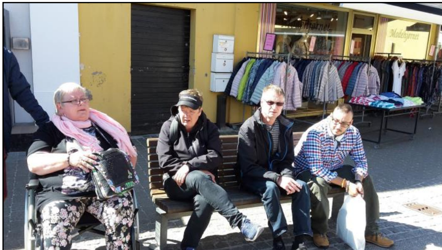
Et tiltrængt hvil.