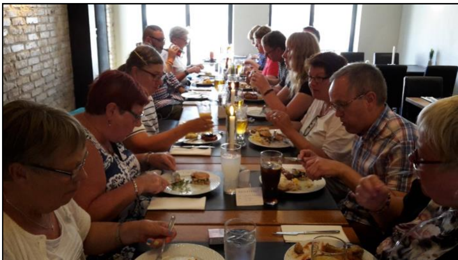
Frokost på restaurant Søborg.