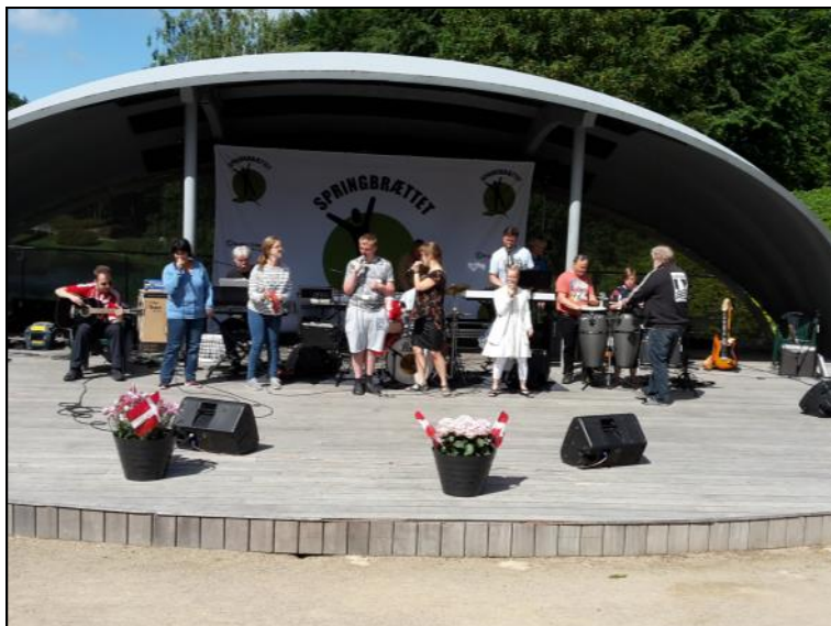
Der spilles musik.