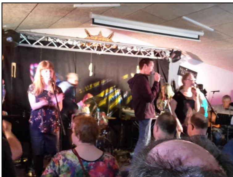
Der spilles musik.