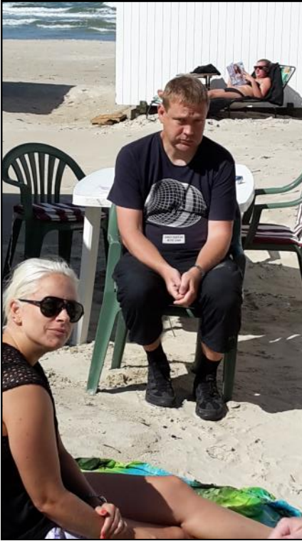
Der spises sandwich.