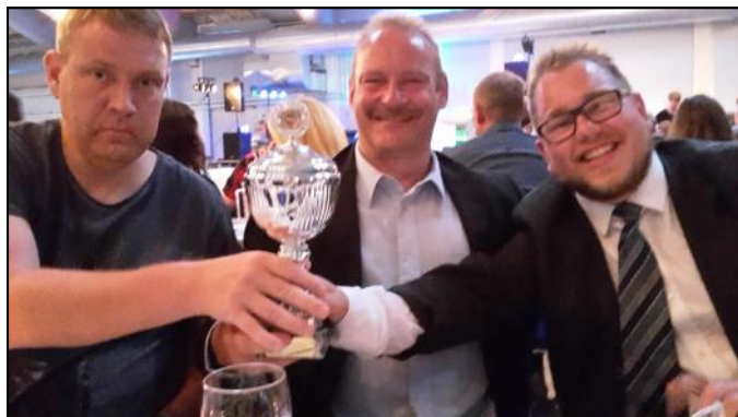
Fair Play pokal 2016. Pokal til evigt minde.