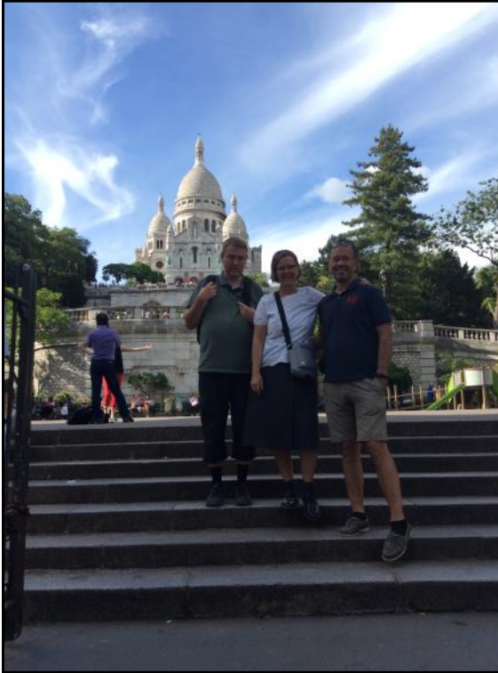
Montmartre. Ved kirken Sacré-Cœur.