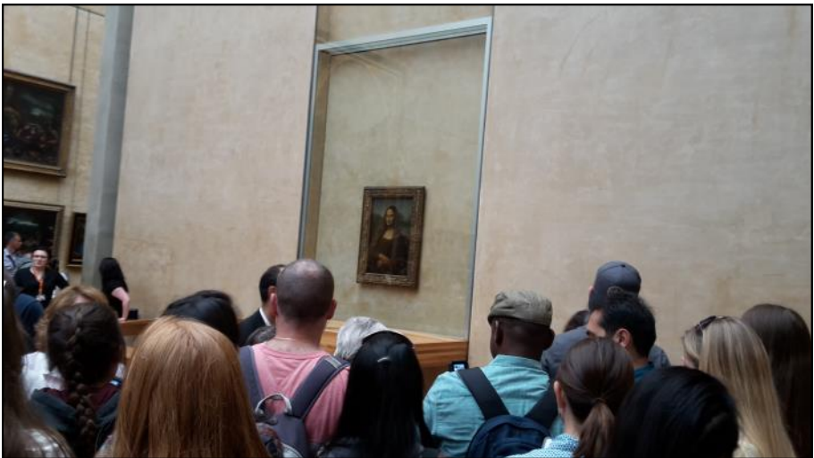
Museet Louvre. Maleriet Mona Lisa, som er malet af Leonardo da Vinci.