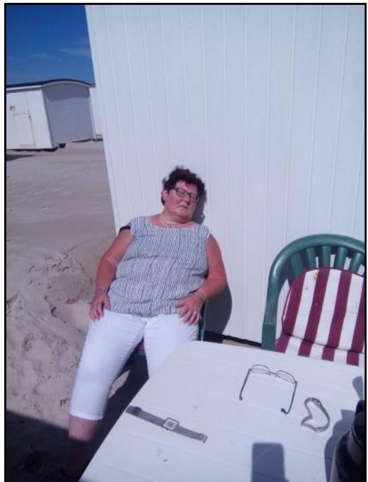
Ulla får et hvil.