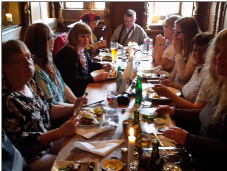
Frokost i Duus vinkælder.