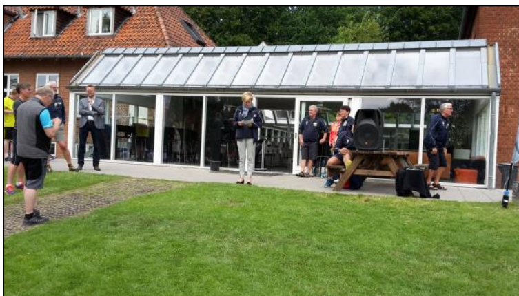
.Kulturminister Mette Bock (LA) holdt åbningstalen.