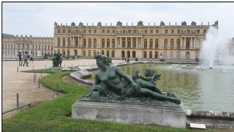
Versailles slottet fra parksideen,