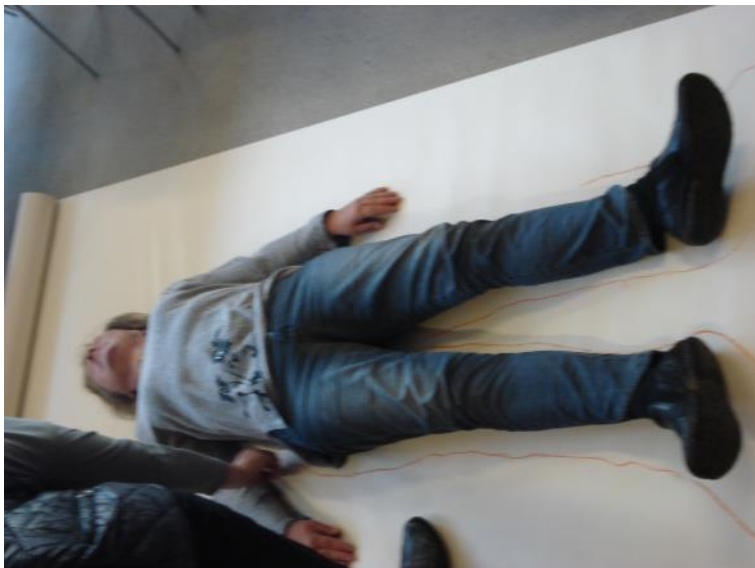
Der tegnes skabelon.