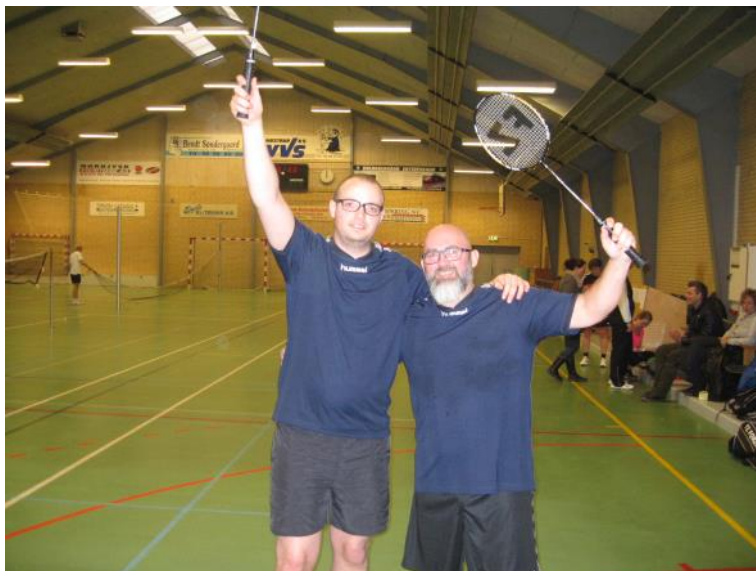
Guldvinderne i badminton.