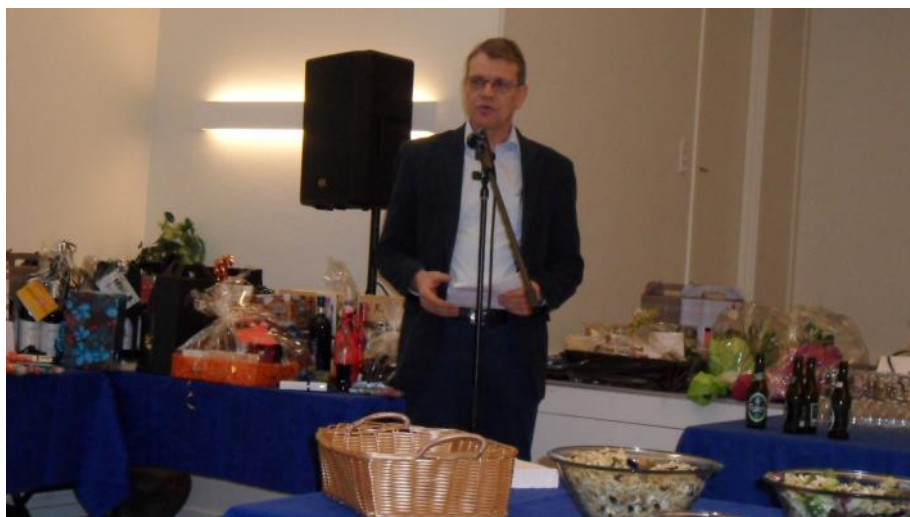
Borgmesteren holder tale.