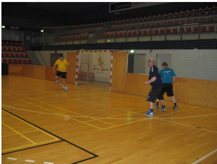
Der spilles fodbold.