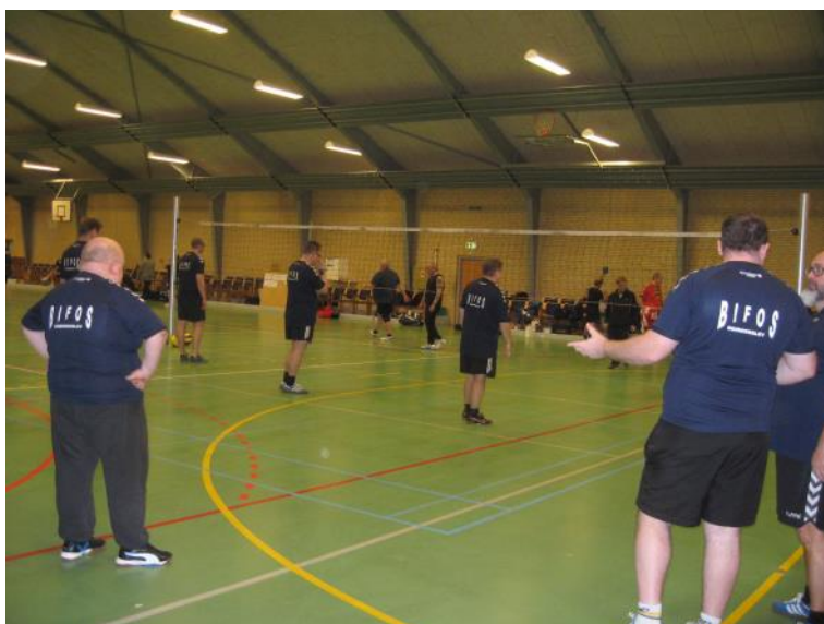
.Der spilles volleyball.