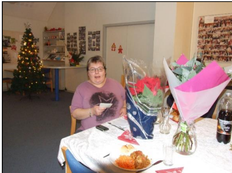
Tine gav lasagne til sin fødselsdag .