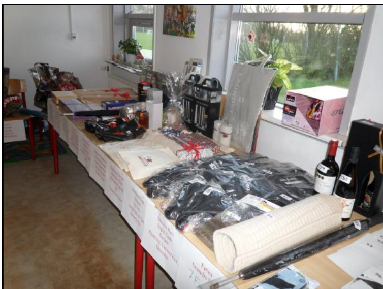
Præmier til tombola.