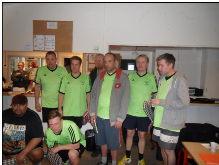
Vinderne af volleyball Idræt og kultur Ålborg.