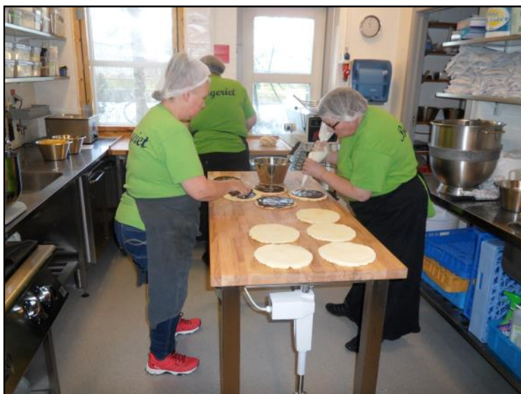
Der laves lagkager i Bageriet.