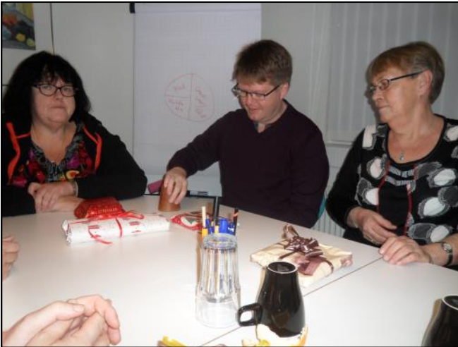
Der spilles pakkespil.