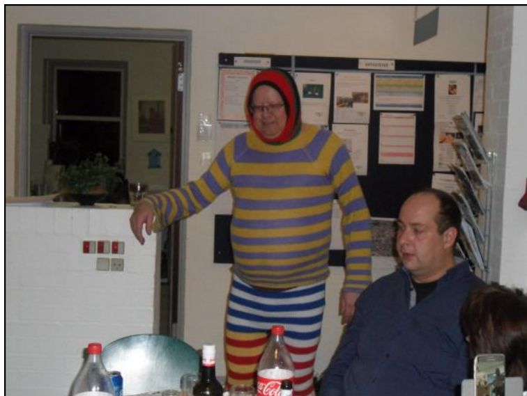
Ole på slap linje.