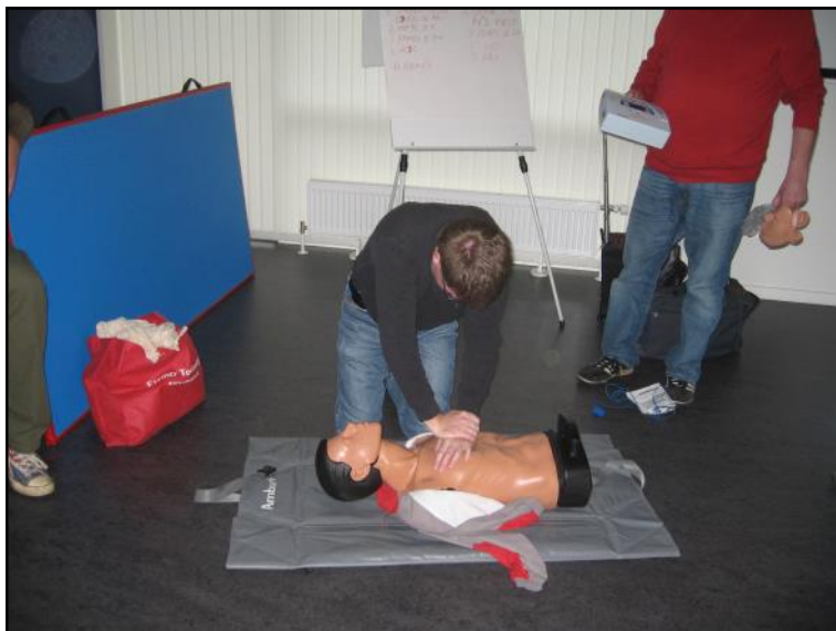
Jan øver hjertemassage.