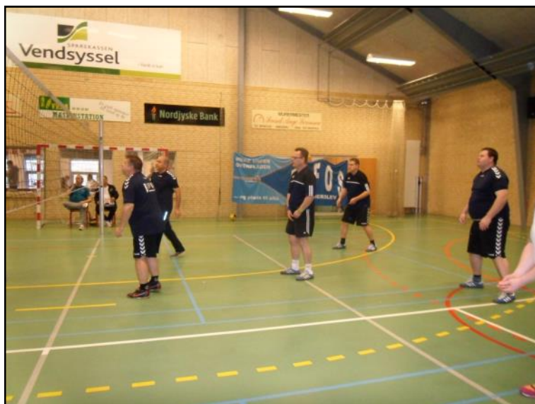
Der spilles volleyball.