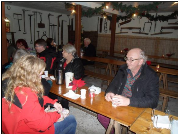
Der spises æbleskiver.