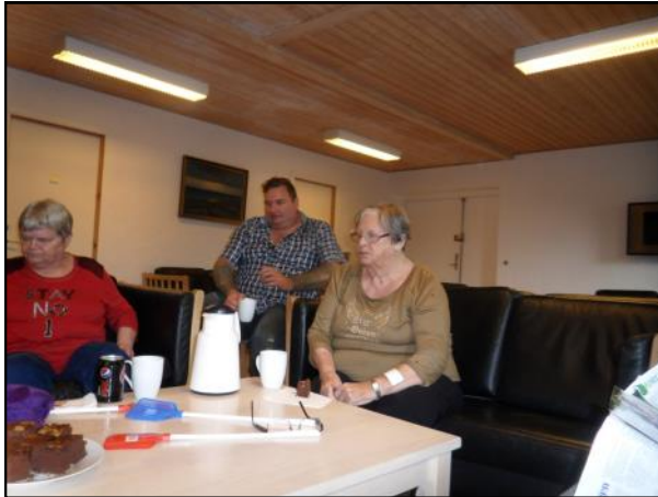
I sommerhus 2017.