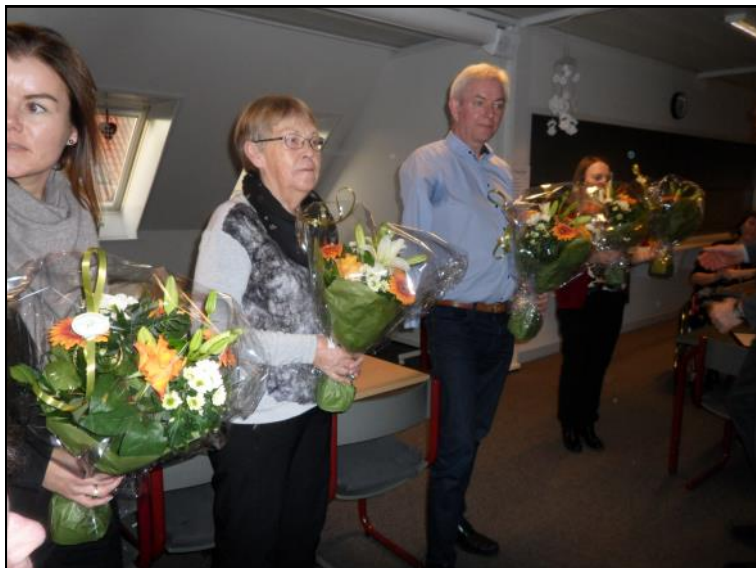
Nominerede til handicapprisen.