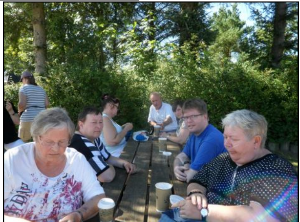
I Fårup sommerland 2015.