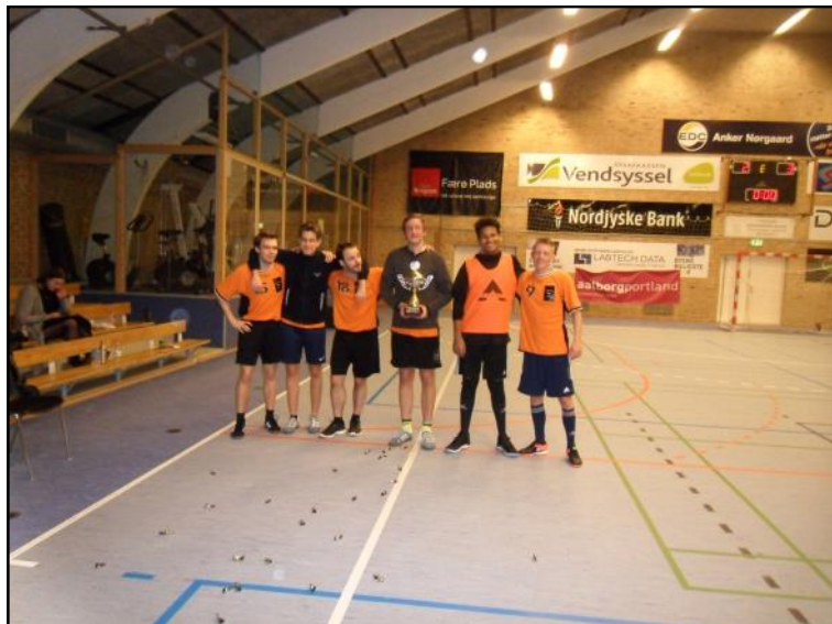
Vinderne blev træningshøjskolen.