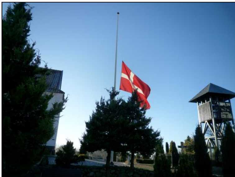
Flag på halv ved Tårs kirke.