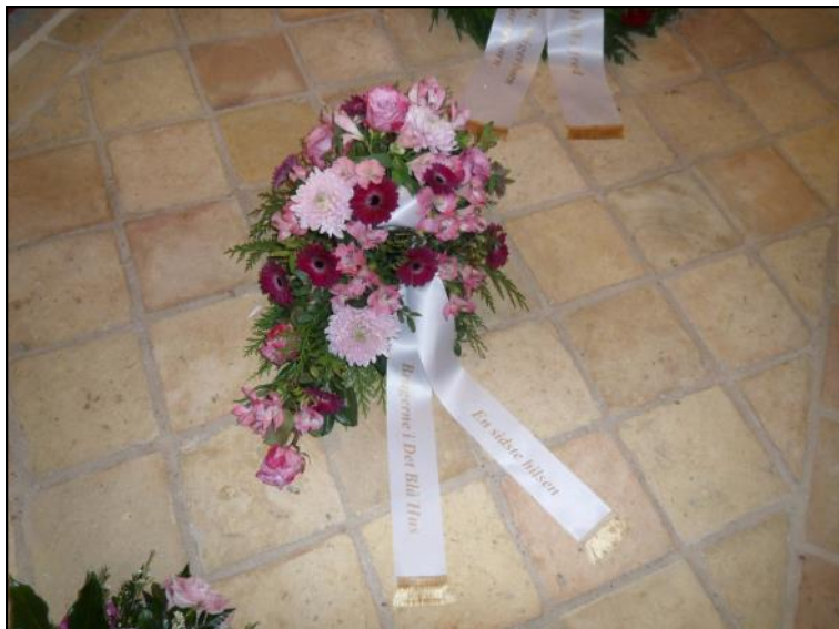
Krans fra Det Blå Hus.