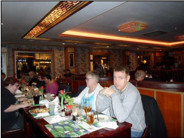
Spising på Bai Sheng.