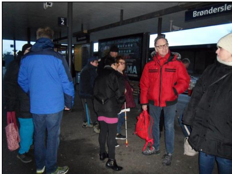
På Brønderslev banegård.