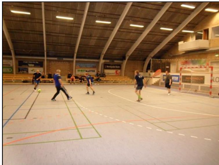
BIFOS i angreb.