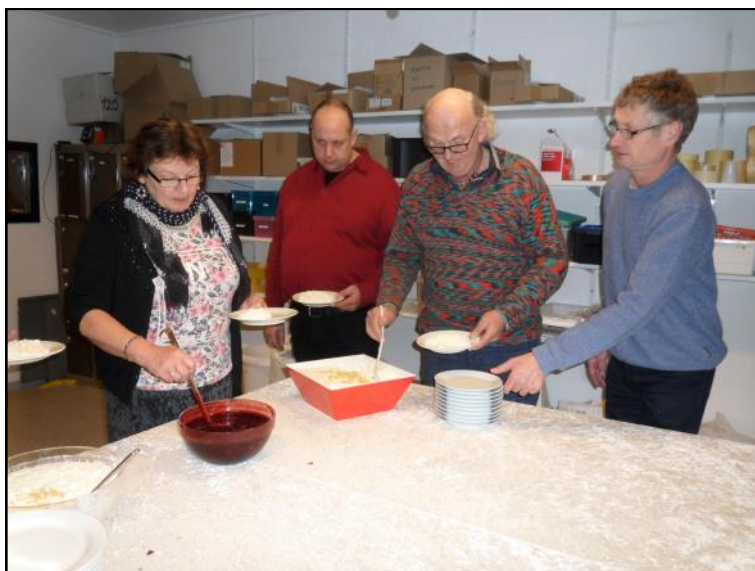
Ris a la mande.