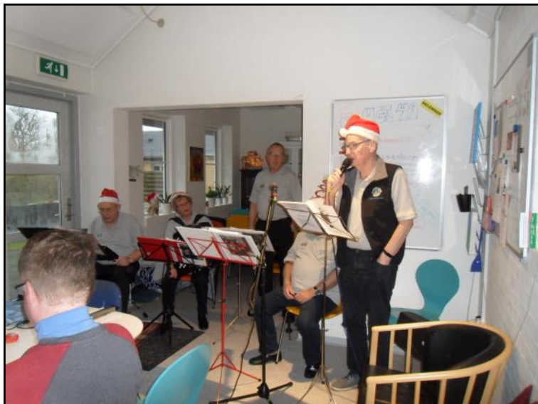
Lions Løver optræder.