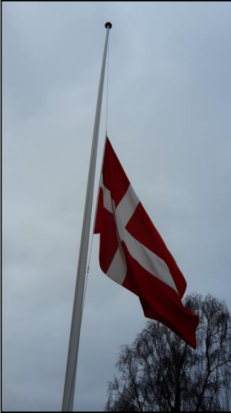
Flag på halv ved Brønderslev gamle kirke.