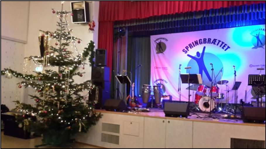
Scenen med flot pyntet juletræ.