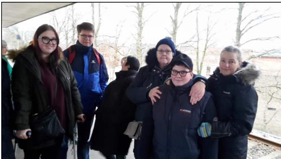
På stationen før vi tager toget til Ålborg.