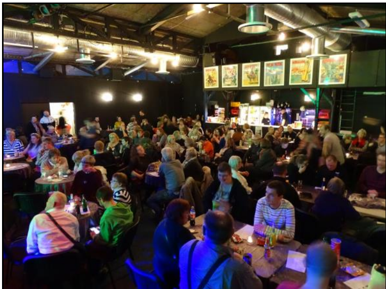
Publikum med baren i baggrunden.