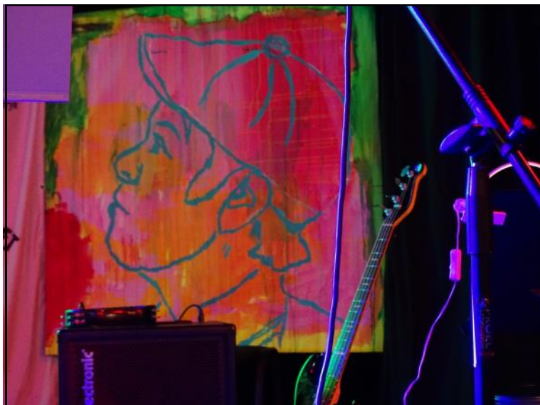
Maleri af Kim Larsen og elbas, der stikker op ved siden af.