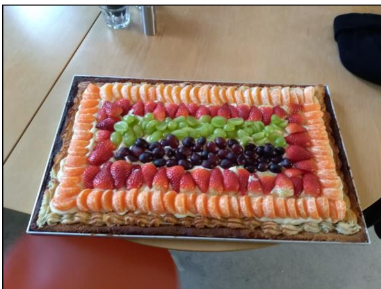
Bageriet havde bagt lækker kage.