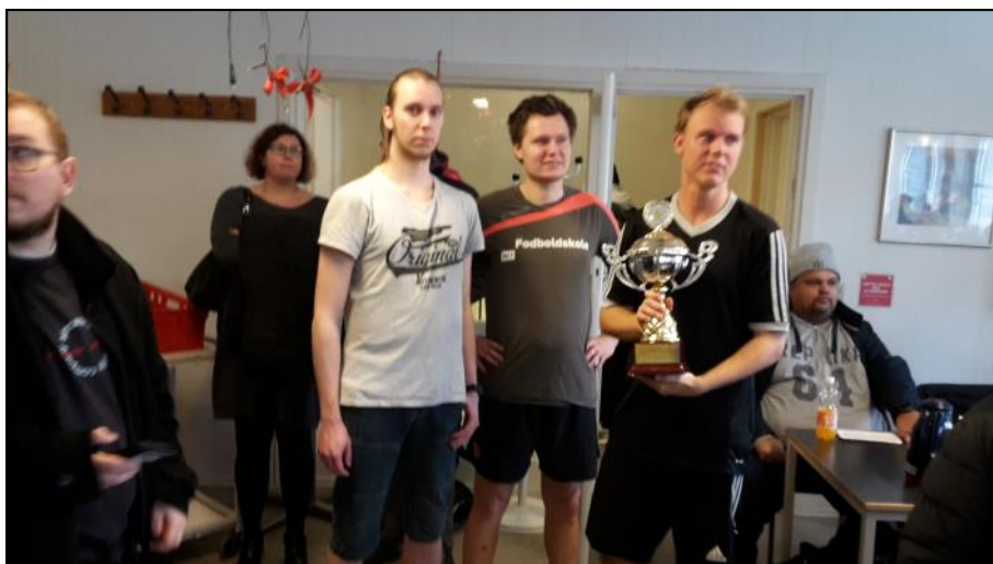
Idræt og Kultur Ålborg blev nr. 1.