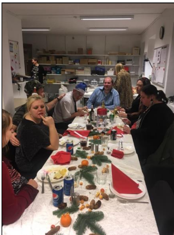
Høj stemning i ungegruppen.