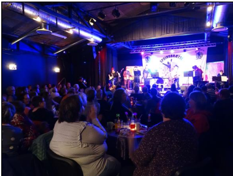
Publikum og scene.