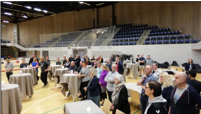
Deltagere i receptionen.