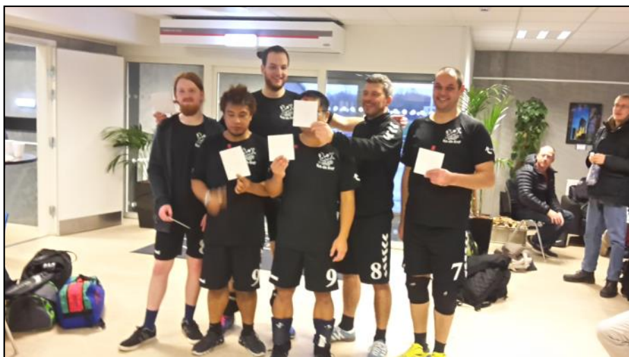
Mob Din Krop Frederikshavn vandt førstepladsen i volleyball.