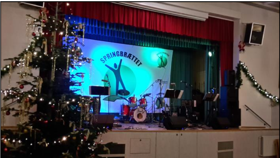
Scenen fra anden vinkel.