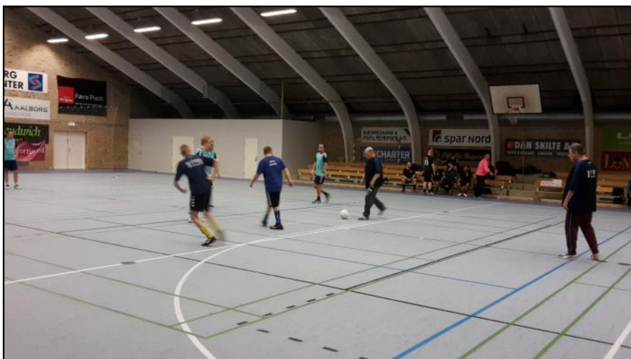
Fodbold på banen.