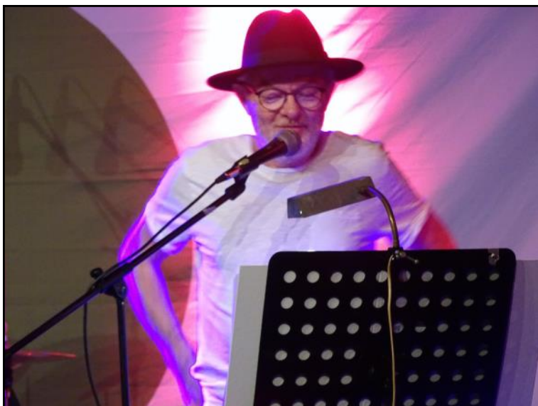
Ole ved mikrofonen.