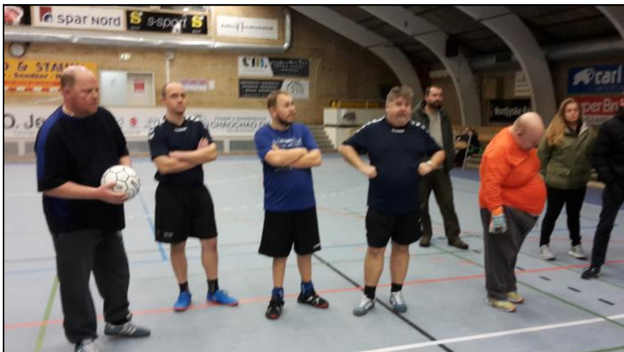
Spillere fra BIFOS.