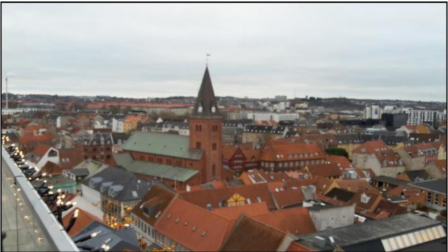
Udsigt fra Salling rooftop.