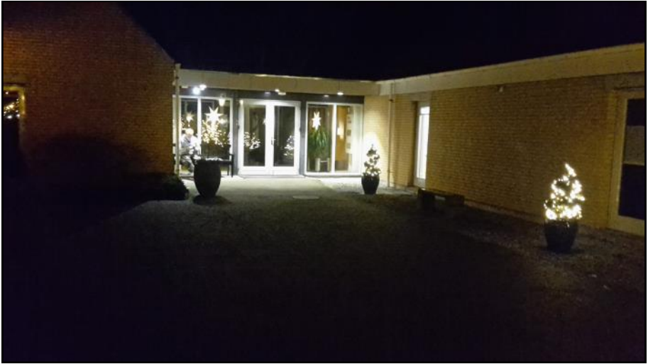
Indgang til Hedebo.