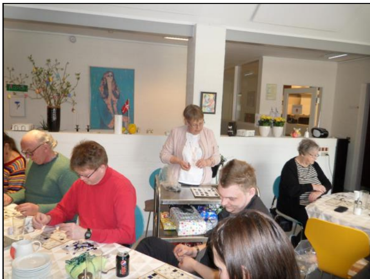
Der spilles banko.