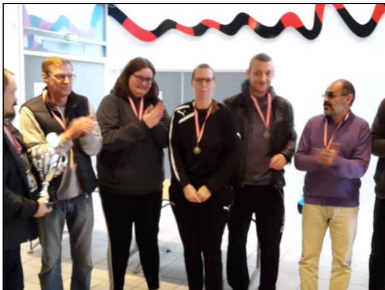
Præmieoverrækkelse - IFS Hjørring.