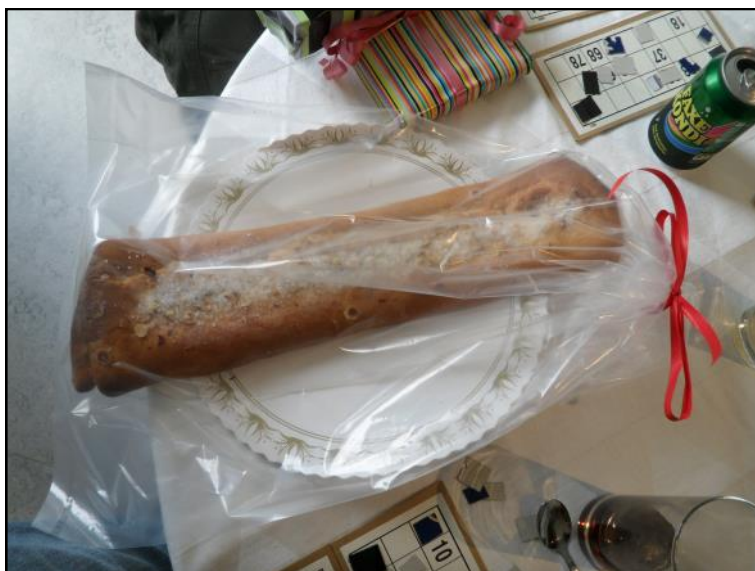
Kringle i præmie.