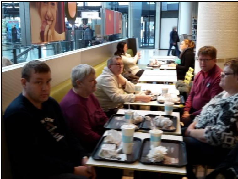
Spising i Metropol.