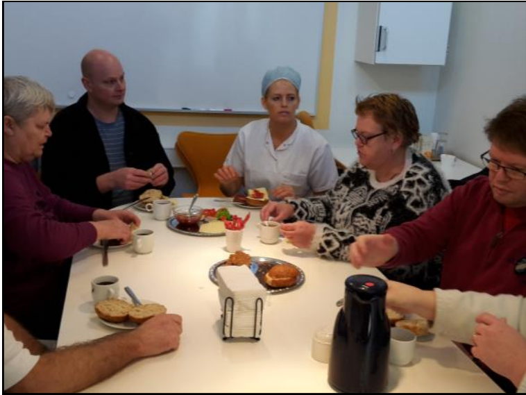
Kaffe og rundstykker.