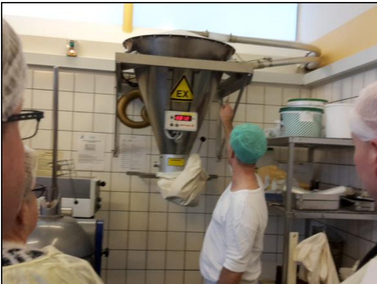
Tragt til mel.