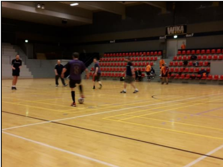
Der spilles fodbold.