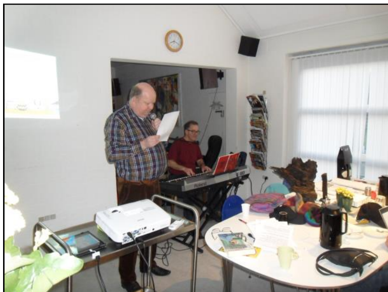
Der synges fællessang.