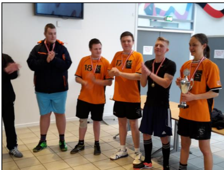
Præmieoverrækkelse - IK Ålborg