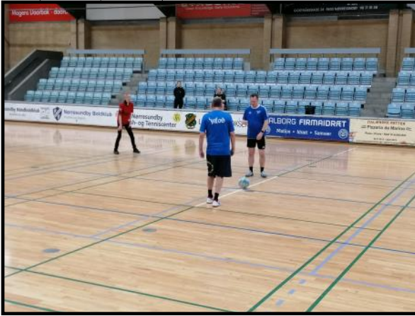
Fodbold. BIFOS giver bolden op.