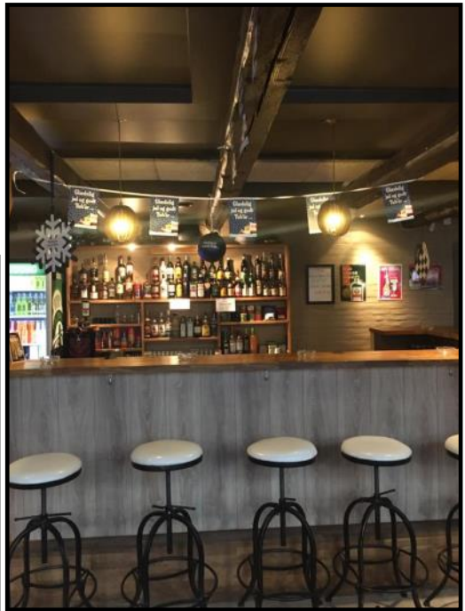
Down Town din Bar.