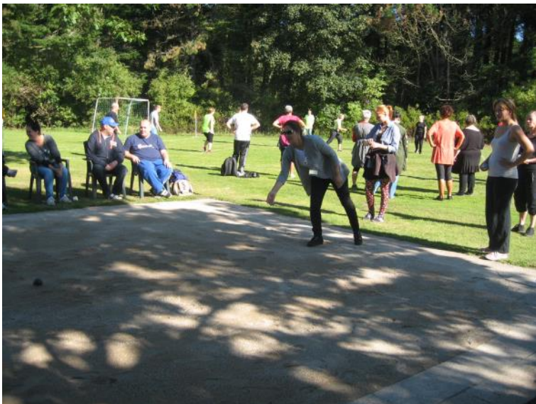
Der spilles petanque.