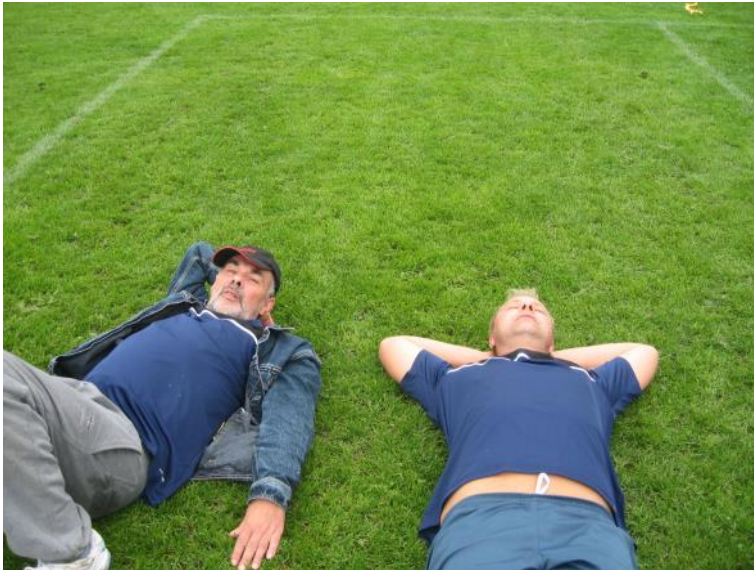
En lur på græsset.