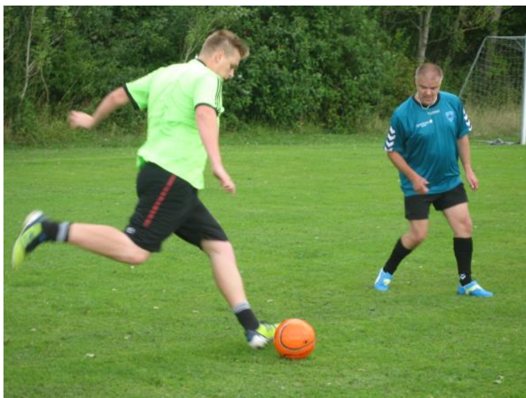
Der spilles fodbold.