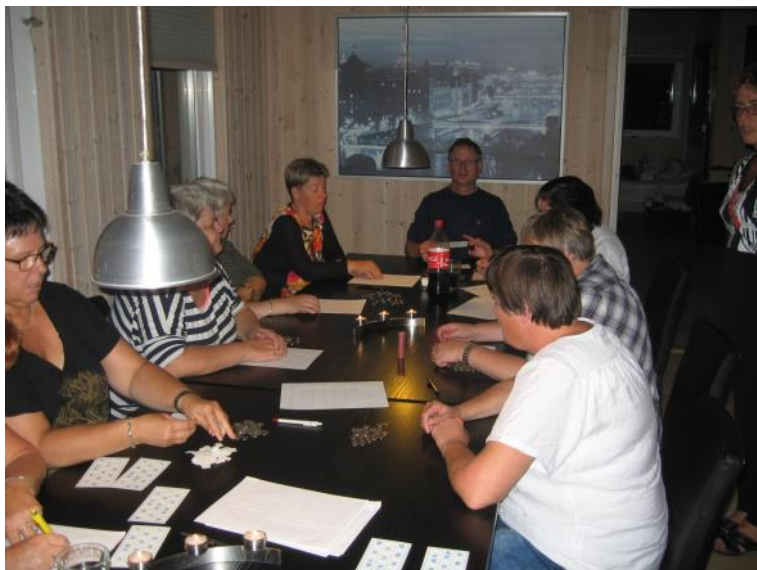
Der spilles banko.