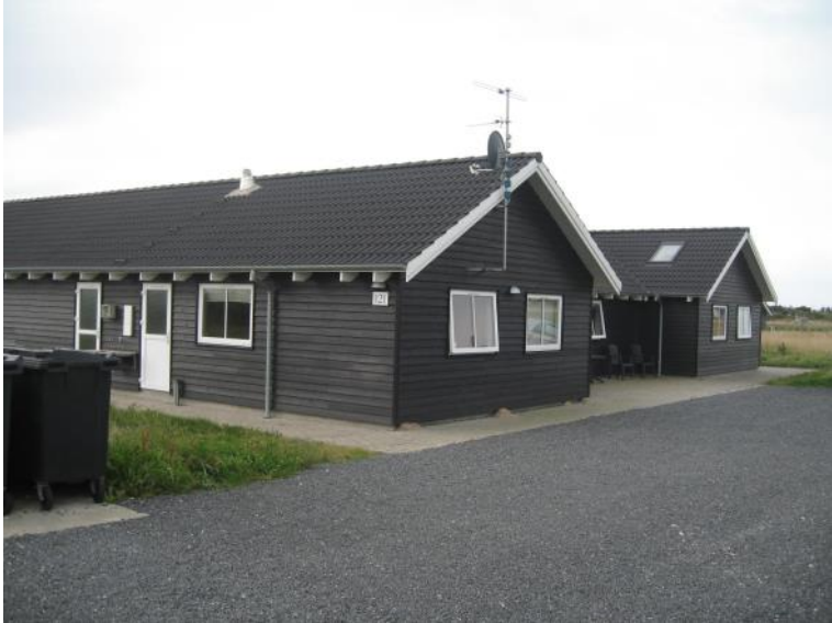
Sommerhuset ude fra.