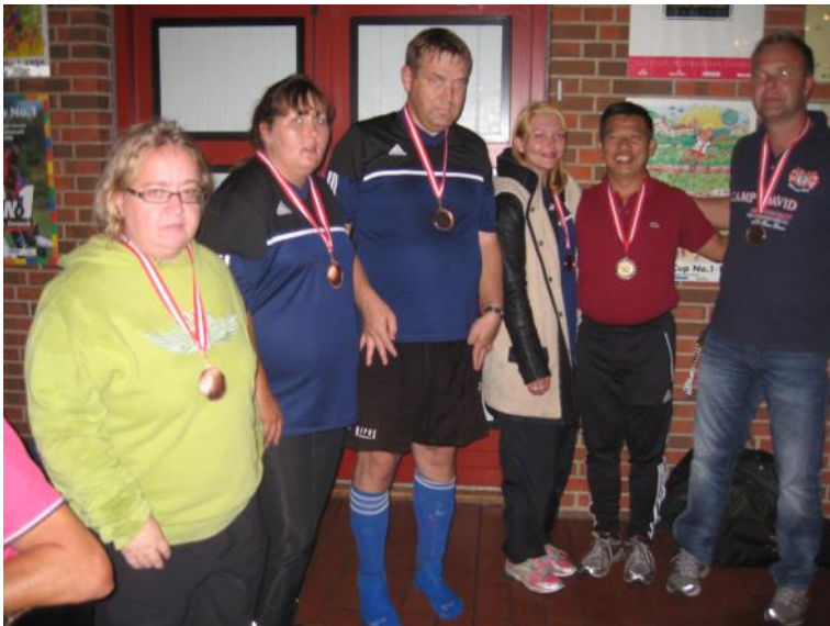
Bronzemedalje i volleyball.