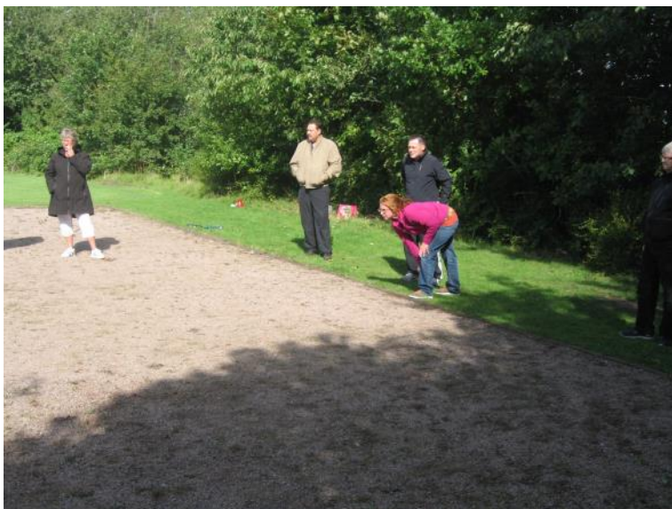
Der spilles petanque.