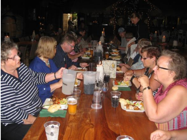
Der spises frokost