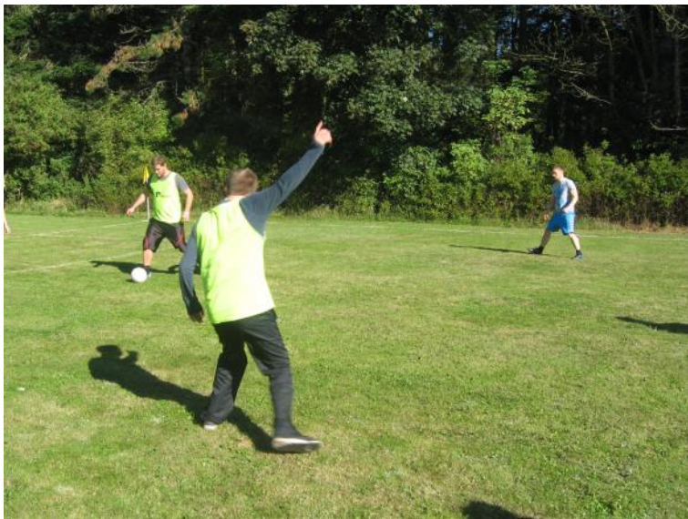
Der spilles fodbold.