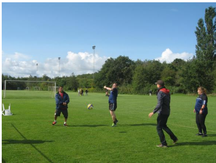
Der spilles volleyball