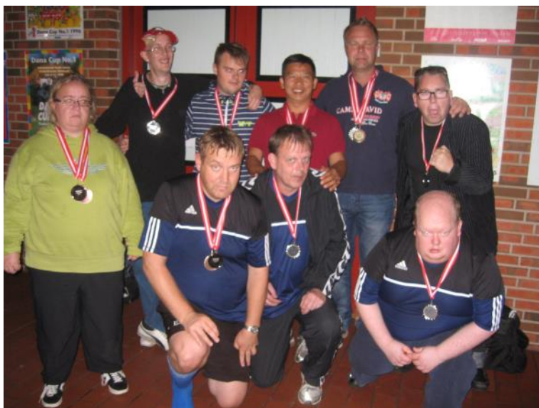
Sølvmedalje i fodbold.