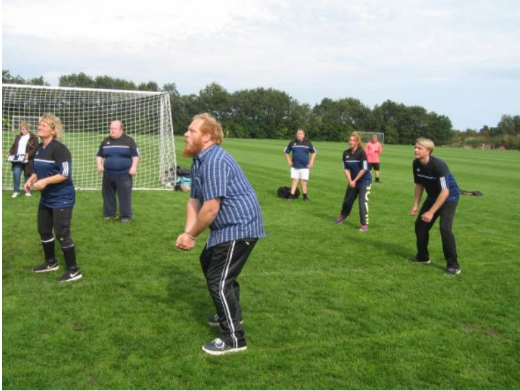
Der spilles volleyball.