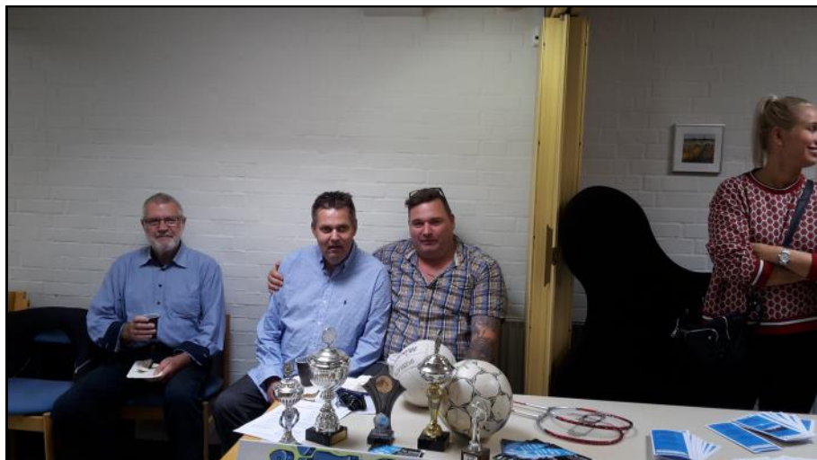
BIFOS med stand.