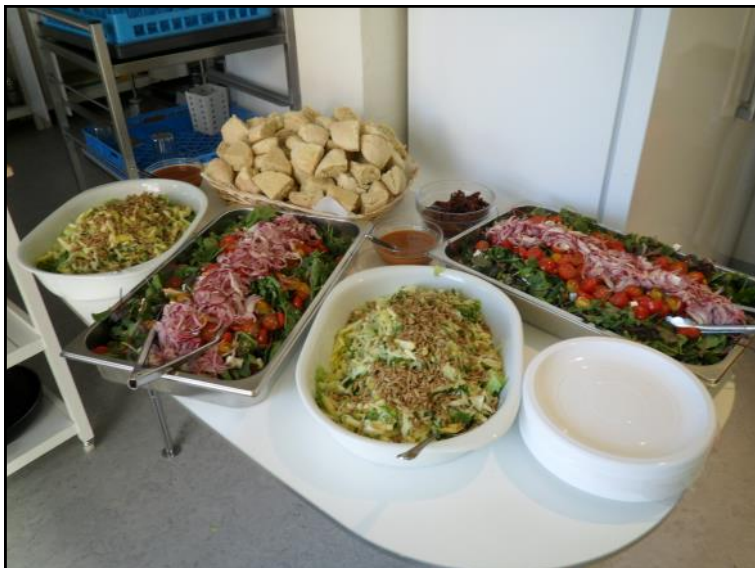
Salat og brød.