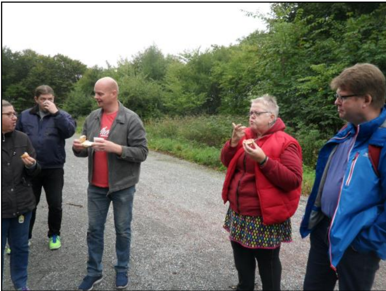
Der spises rundstykker.