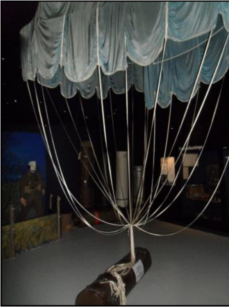
Faldskærm med udstyr til sabotage nedkastet af englænderne under 2. verdenskrig.