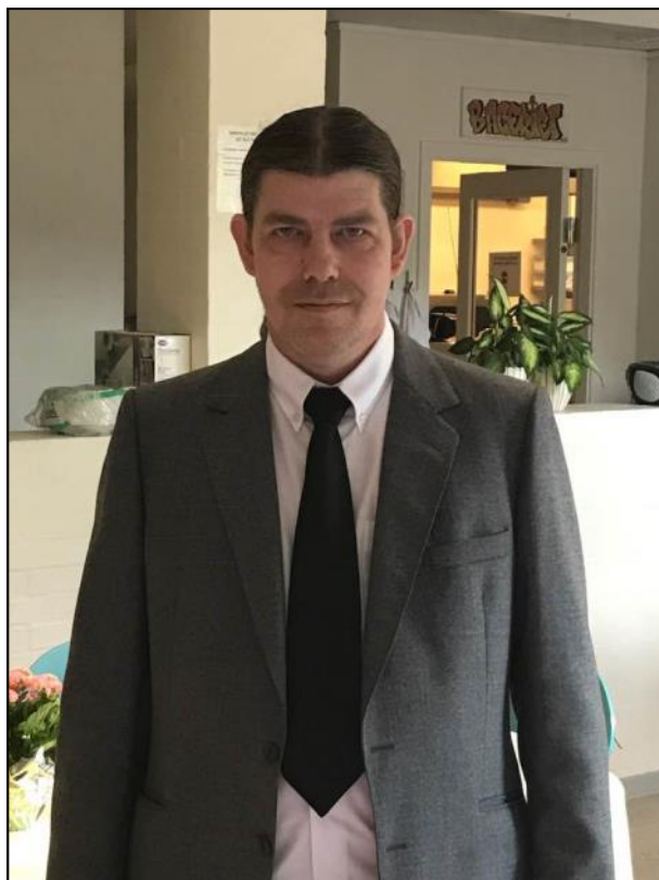
Carsten fint i tøjet.