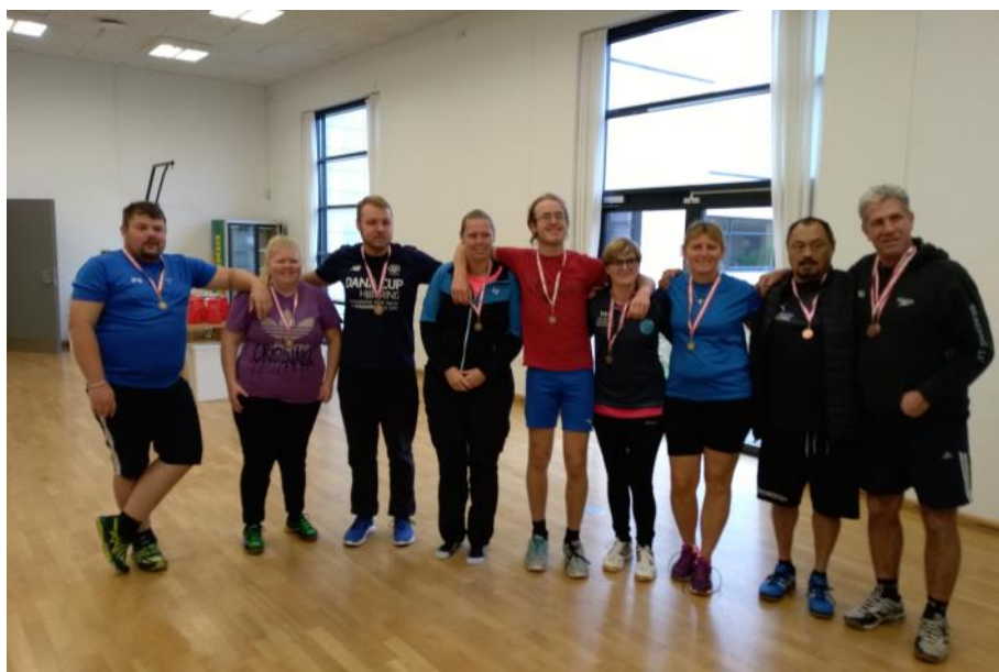
Volleyball, nr. 3 IFS Hjørring.