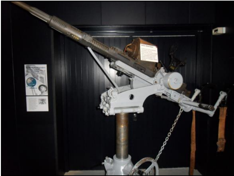
Kanon fra 2. verdenskrig.