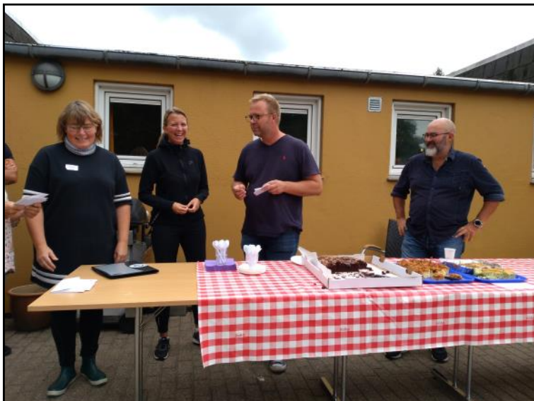
Personale fra psykiatrisk sygehus.