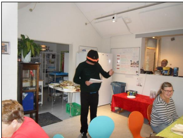
Ole på slap linje.