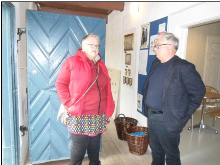
Hanne og guiden.