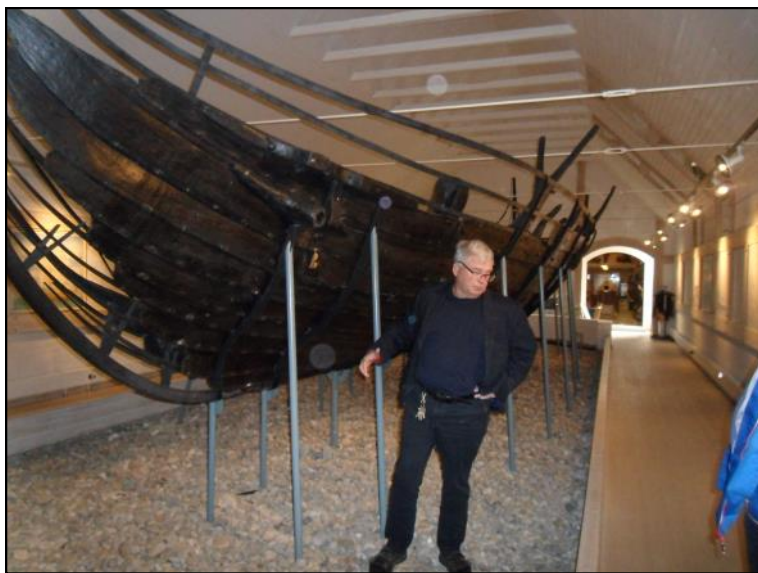
Det unikke Ellingåskib fra 1163.