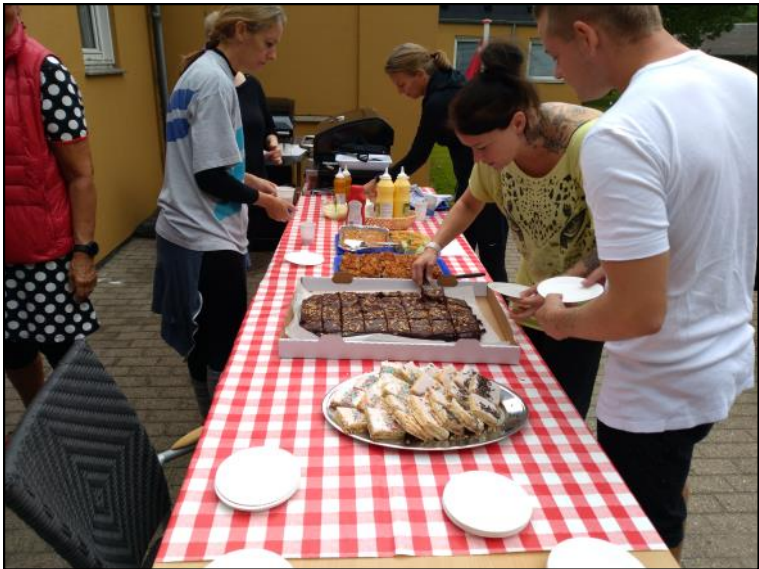
Pølser og kage.