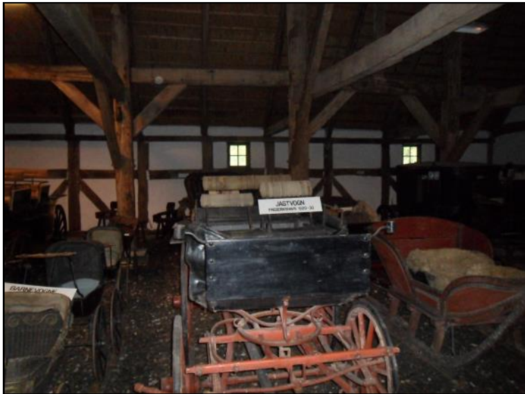
Jagtvoan fra 1920-1930 fra Frederikshavn.