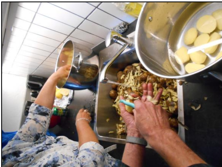
Der skrælles kartofler.