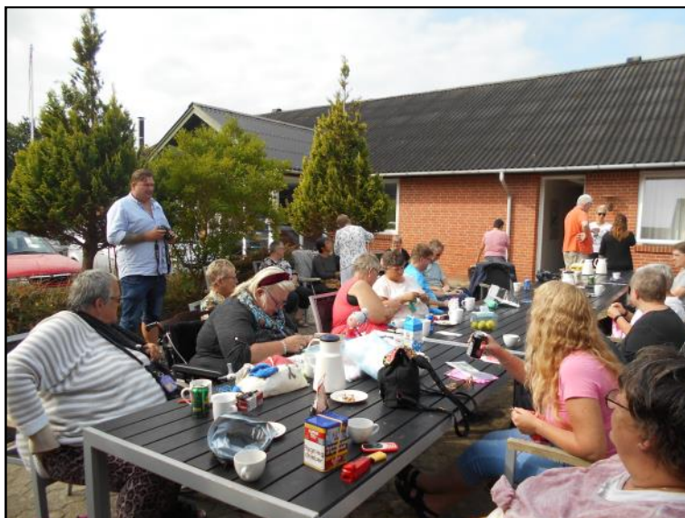
Besøg fra Det Blå Hus.