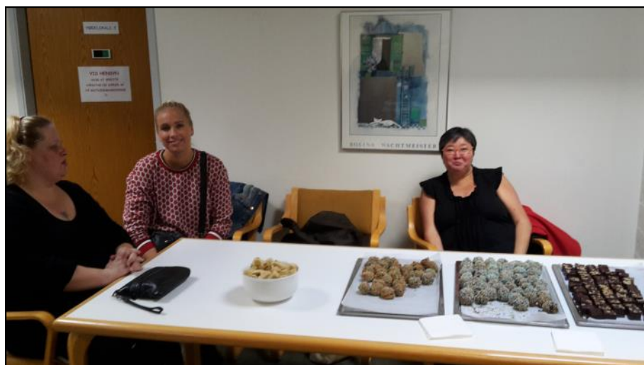
Det Blå Hus, Bageriet