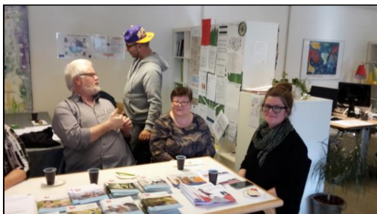
SIND med stand.